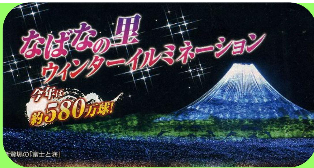
新登場の「富士と海」